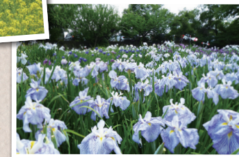
会津美里町の花「あやめ」