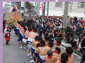
商売繁盛・五穀豊穡を祈願する冬の勇壮な祭り「大俵引き」は、毎年1月第2土曜に開催

旧会津高田町、会津本郷町、新鶴村が合併してから16年。それぞれの地域の雰囲気大切にしながら、さまざまな取り組みを行っています。 令和元年5月には高田地域に、町役場本庁舎と図書館および公民館を併設した「じげんプラザ」が開庁しました。