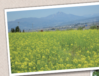
八木沢地区に広がる菜の花畑