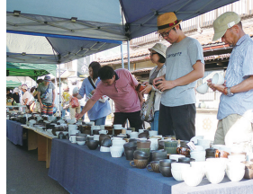
毎年8月第1日曜の「本郷せと市」は値頃感ある陶磁器が並びます