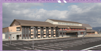
町役場本庁舎及び複合文化施設「じげんプラザ」