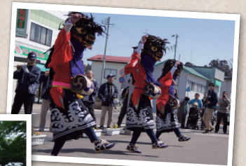
西勝地区の彼岸獅子